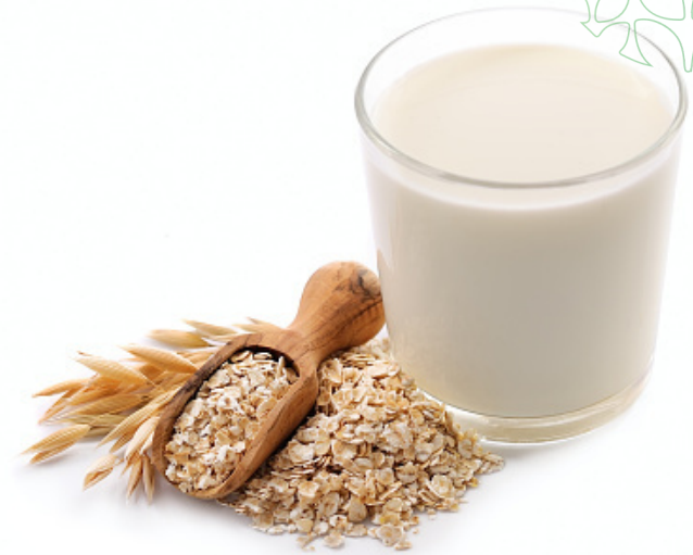
leite de aveia