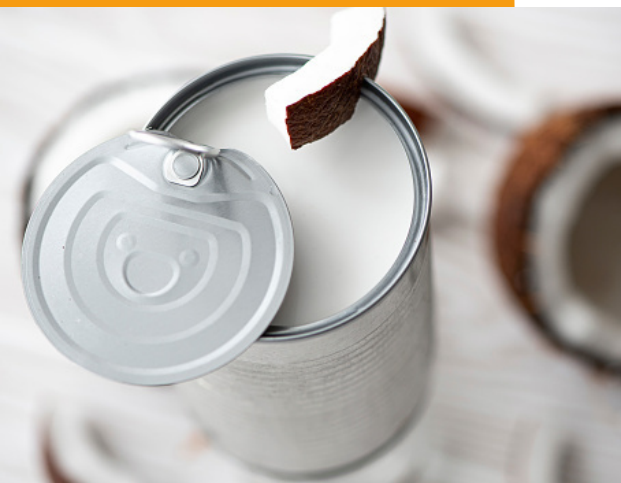
leite de coco enlatado