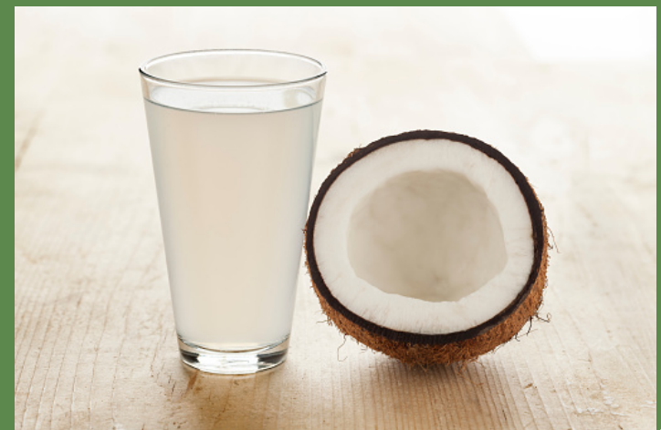
água de coco sem polpa