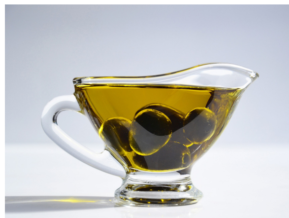
azeite de oliva