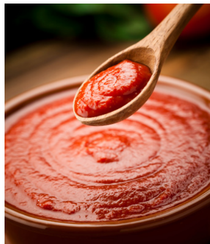
pasta de tomate