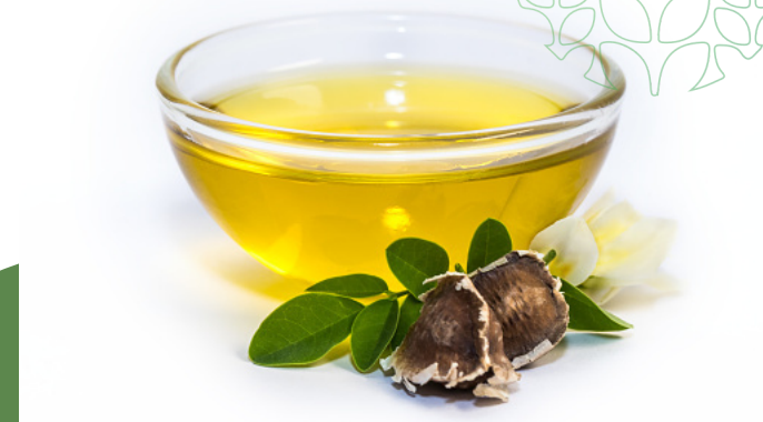
oléo de moringa