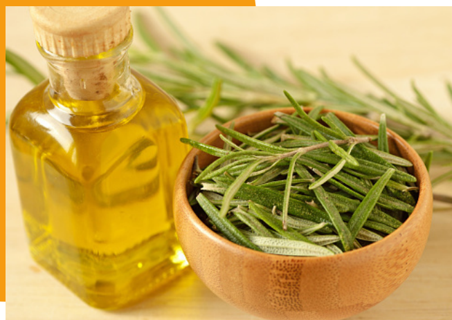
oléo de alecrim