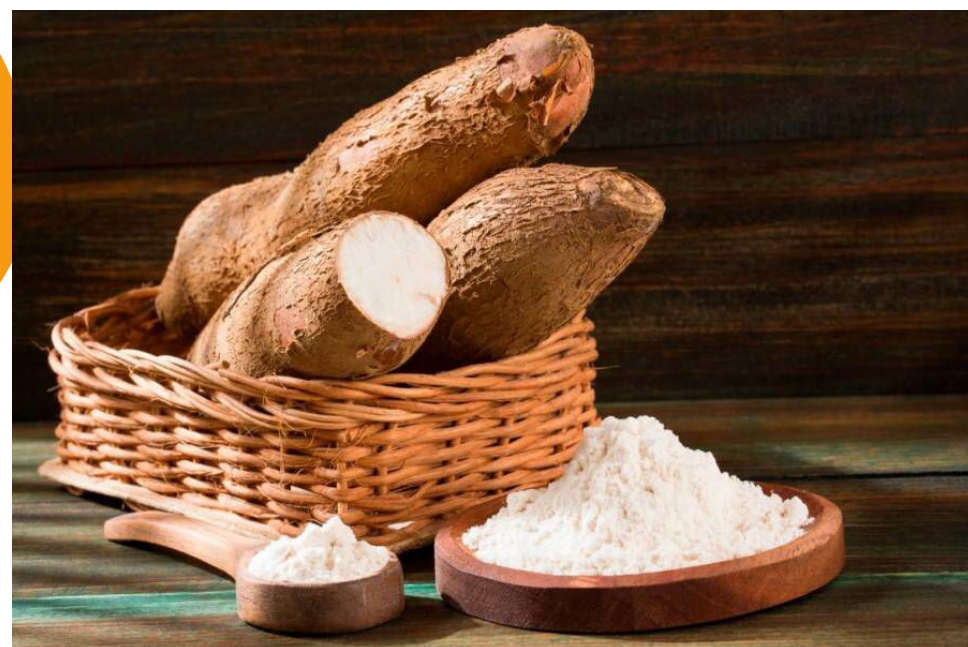
farinha de bombó - mandioca