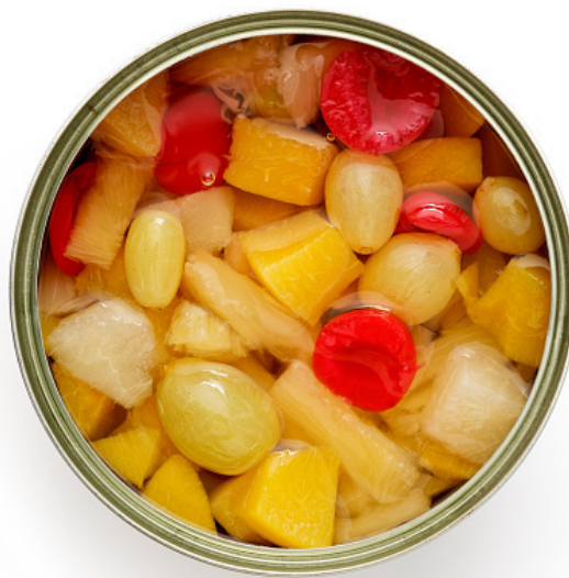
mistura de fruta