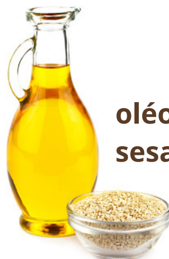
oléo de sesamo