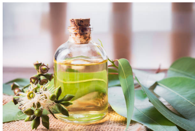
oléo de eucalipto