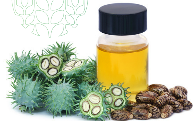
oléo de castor