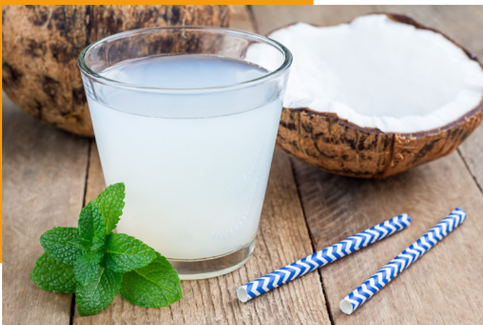
água de coco com polpa