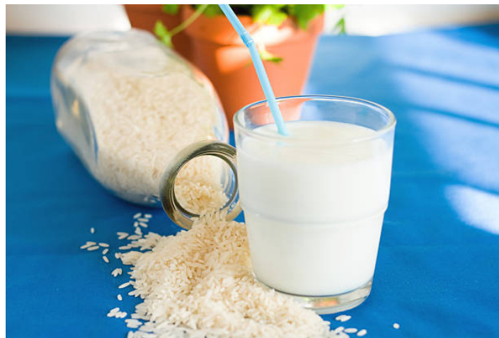
leite de arroz