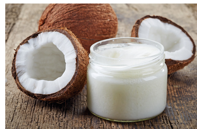
oléo de coco