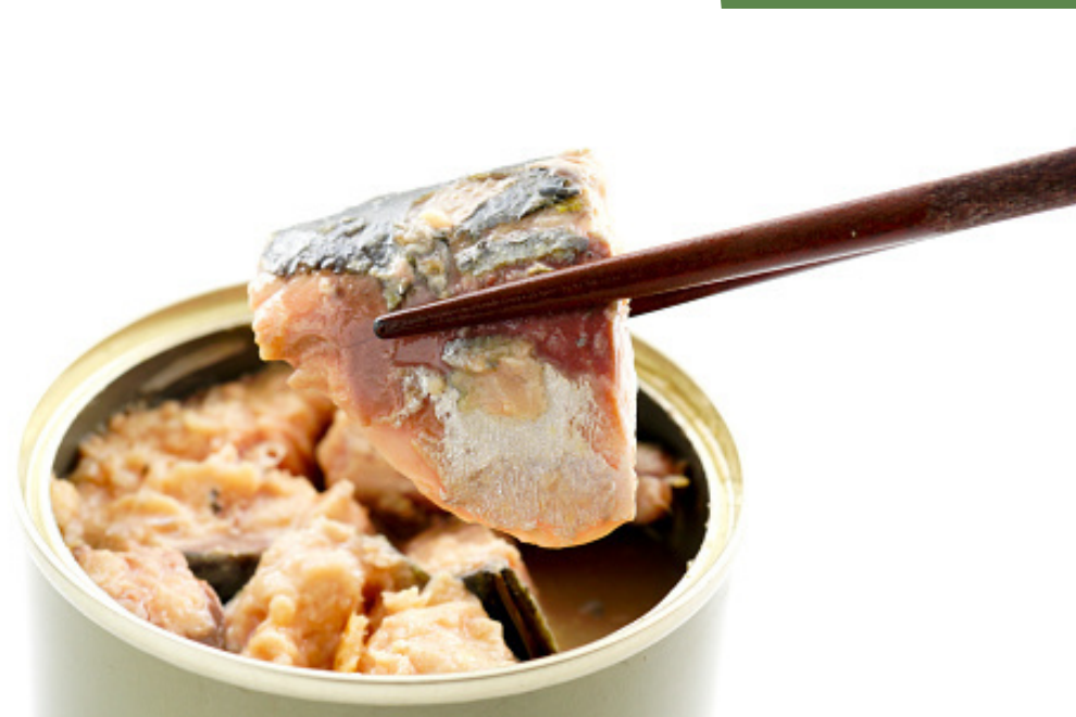
carapau em lata