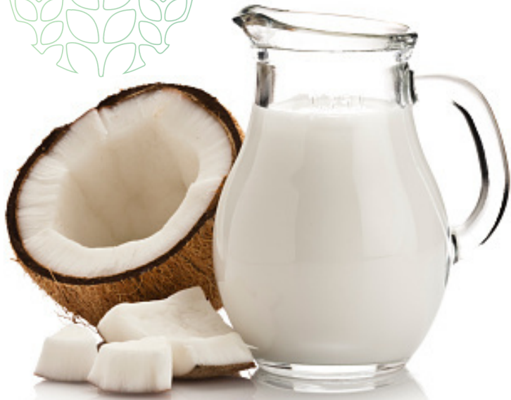
leite de coco