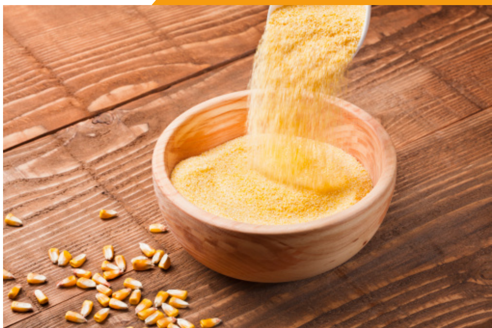
farinha de milho