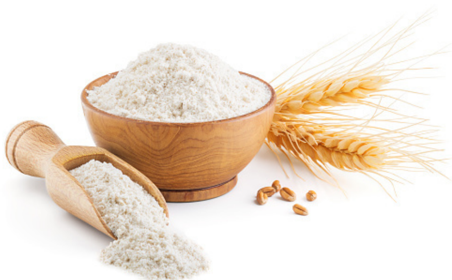
farinha de trigo