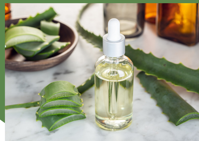
oléo de aloe vera