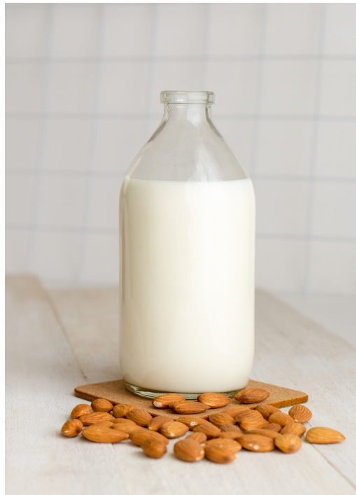
leite de amêndoa