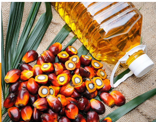
oléo de palma