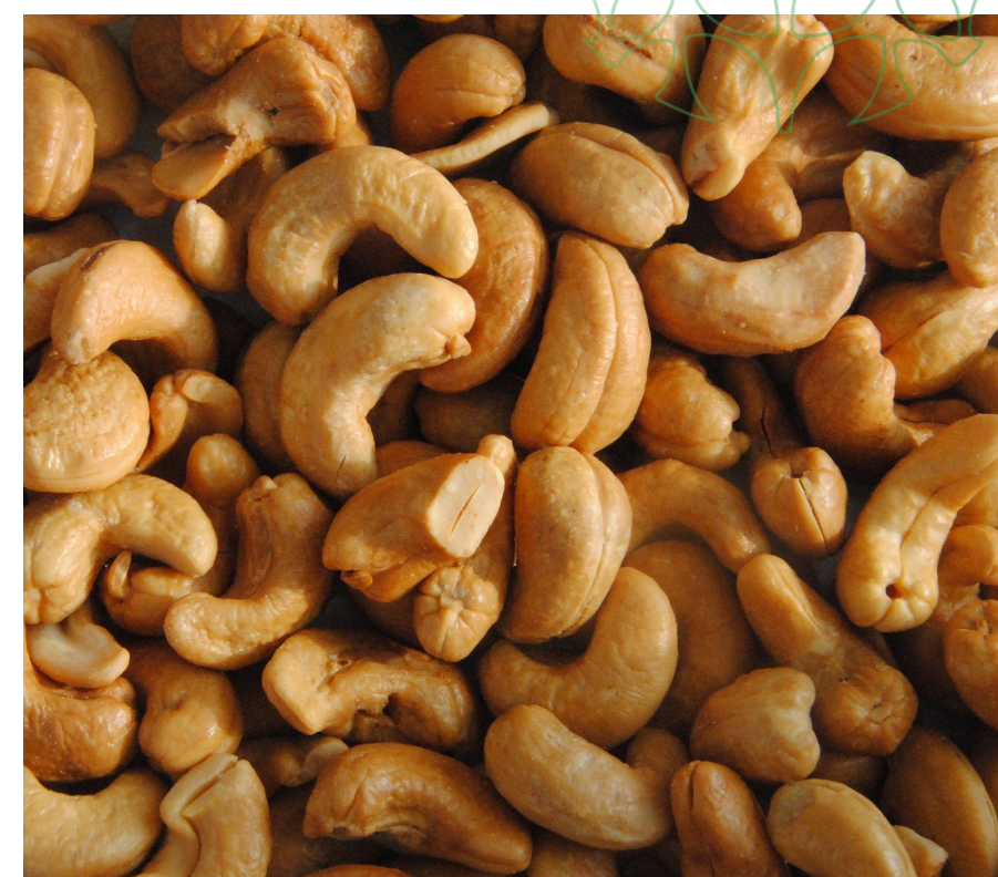
Castanha de Cajú