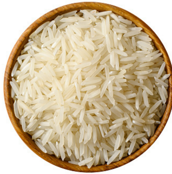
basmati Pusa 1121