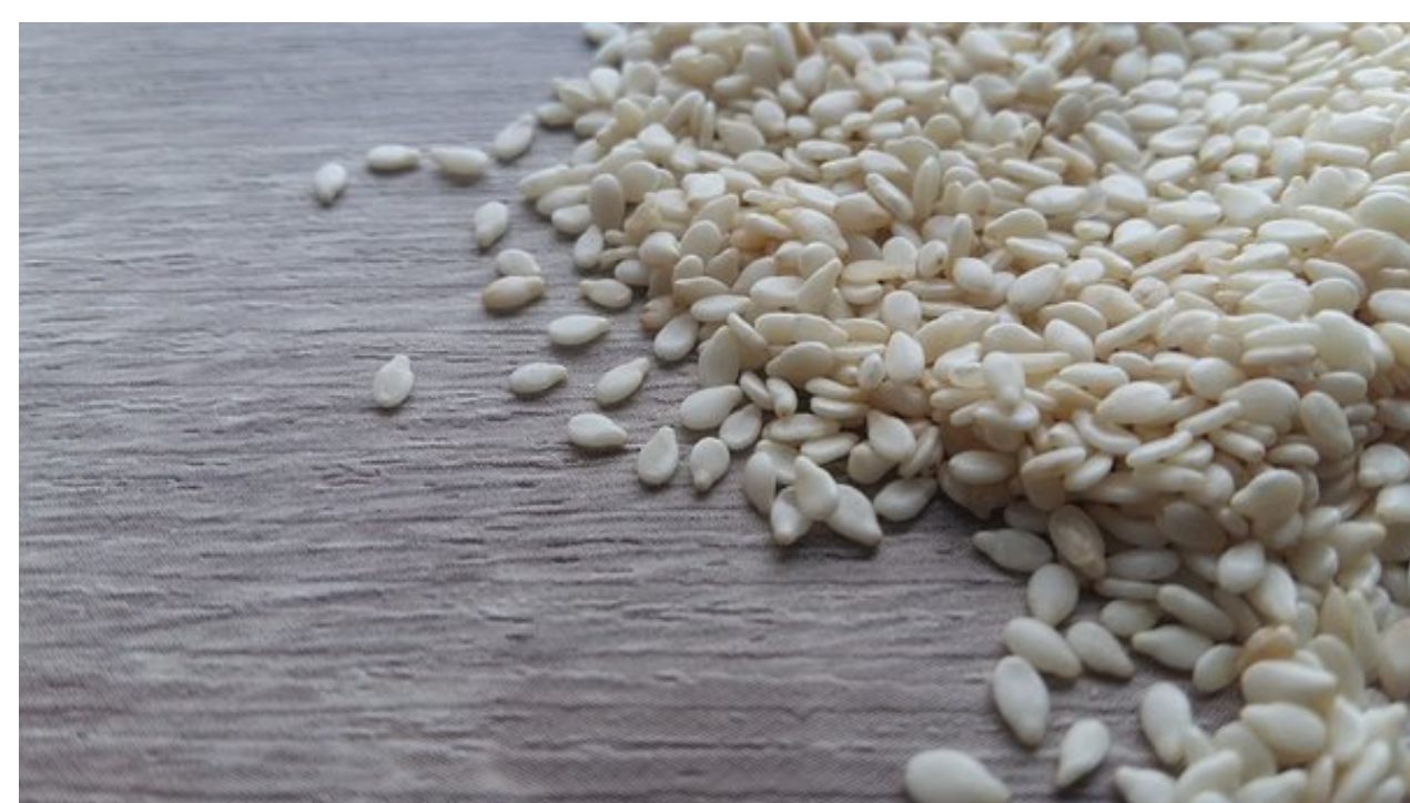
Sésamo - Gergelim