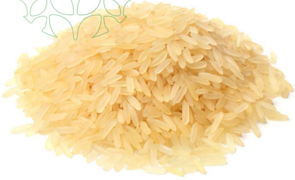
basmati sella dourada